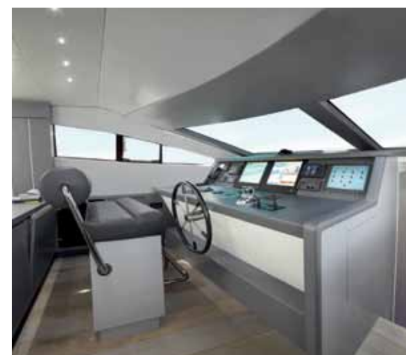
Above: the large sunbathing area on the fly and the dining table. Opposite, clockwise from left: the VIP; a twin cabin; the owner's suite / Sopra, l'ampio prendisole sul fly con zona pranzo. Sotto, la tecnologica postazione di comando. Pagina a fronte, da sinistra in senso orario: la cabina Vip, una ospiti e l'armatoriale.